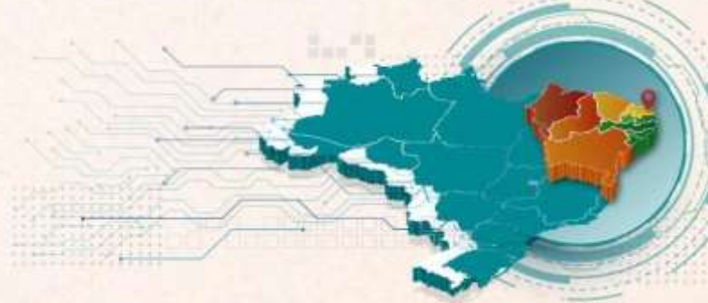
Figura 2 – Fases do processo de implementação do Censo dos Servidores Ativos